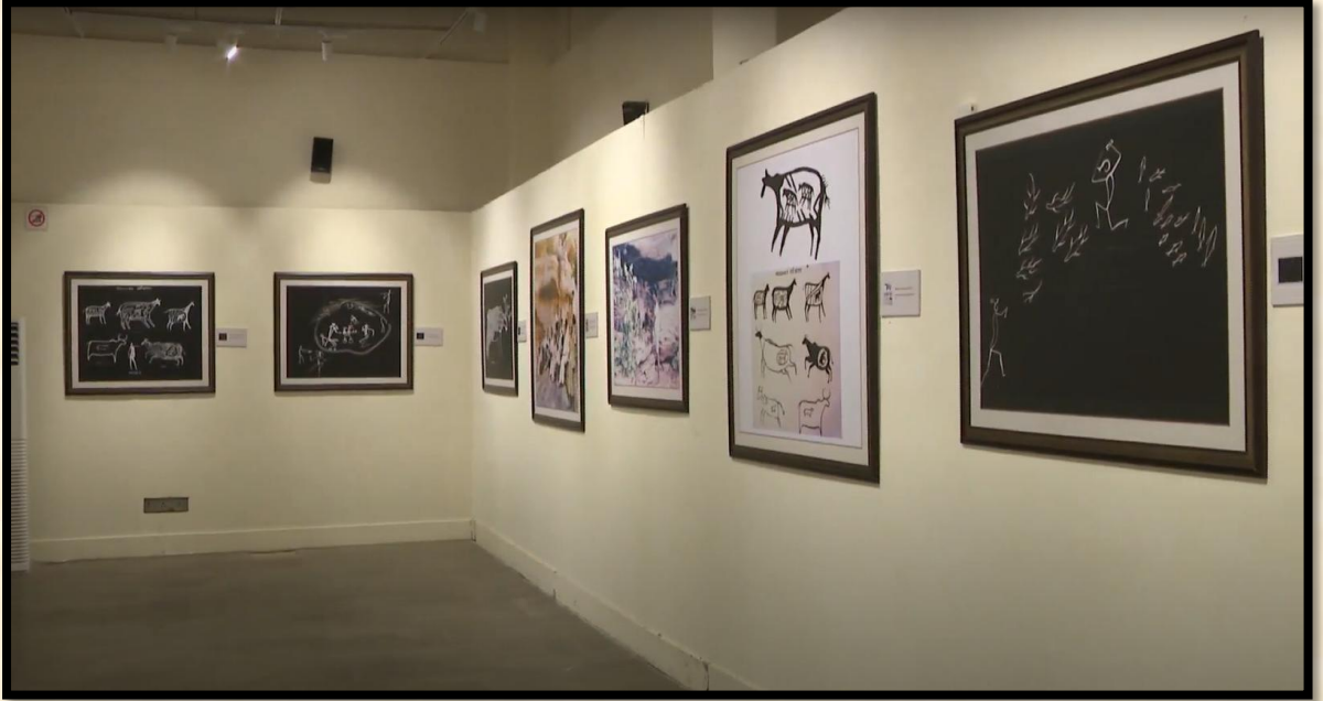
आभासी प्रदर्शनी 'दी लिगेसी ऑफ डॉ० वी० एस० वाकणकर'

गत वर्ष (2019–20) प्राच्या भारतीय संस्कृति व सभ्यता के संवाहक के रूप में विश्वपटल पर दृष्टित, भारतीय शैलचित्र के 'पितामह' भीमबेटका पुरास्थल व प्राचीन भारतीय सभ्यता का केंद्र बिंदु वैदिक नदी सरस्वती के प्राचीन प्रवाहपथ के खोजकर्ता, पुराविद्, कलासाधक, भारतीय संस्कृति व सभ्यता के 'युगदृष्टा', पद्मश्री विष्णु श्रीधर वाकणकर का शताब्दी वर्षोत्सव के अवसर पर इंदिरा गाँधी राष्ट्रीय कला केन्द्र, नई दिल्ली के आदि दृश्य विभाग द्वारा 'दी लिगेसी ऑफ डॉ० वी० एस० वाकणकर' विषय पर फेसबुक तथा यूट्यूब के माध्यम से आभासी प्रदर्शनी का आयोजन दिनांक 4 मई, 2020 को किया गया।